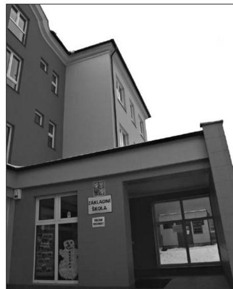
Občané volebního okrsku č. 252 mohli volit v nově zrekonstruované budově Základní školy v Halasově ulici.

V šesti volebních okrscích obvodu Vítkovice byla v prvním kole přímé prezidentské volby volební účast 34,99 procenta, v kole druhém 38,53 procenta. V prvním kole získal největší počet hlasů (655) Miloš Zeman, 377 patřilo Jiřímu Dienstbierovi, 311 Janu Fischerovi, 273 Karlovi Schwarzenbergovi (více informací o dalších kandidátech naleznete na www.vitkovice.ostrava.cz nebo na www.volby.cz ). V kole druhém vítkovičtí občané dali 70,99 procenta hlasů Miloši Zemanovi, 29 procent hlasů získal Karel Schwarzenberg.