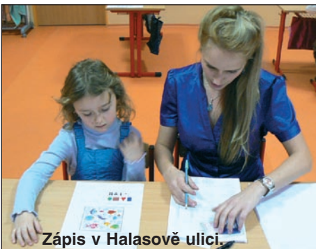
Zápis v Halasově ulici.