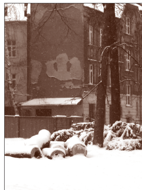
Park za bývalým kinem Mír.